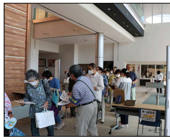
9時半の開場時はたくさんのお客様がご来館

8月18日(日)、毎年実施している優秀映画鑑賞推進事業として、第20回たまきな映画のつどいを開催しました。当日はカラッと晴天、9時半の開場前に、映画を楽しみされていたお客様が9時前から続々とご来場されました。当日券で約60枚購入があり、約300人の皆様に映画をご鑑賞いただきました。