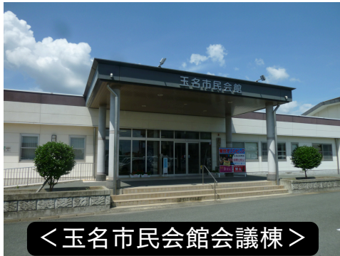
<玉名市民会館会議棟>

【受付時間】8:30～17:00 【利用時間】9:00～22:00 【休館日】12/29～翌年1/3 【部屋】第1会議室(180人)、第2会議室(90人)、第3会議室(45人)、第4会議室(30人)第5会議室(24人)、和室(6畳6～8人) 【問合せ】0968-73-5107