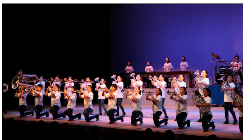
目の前での演奏は圧巻