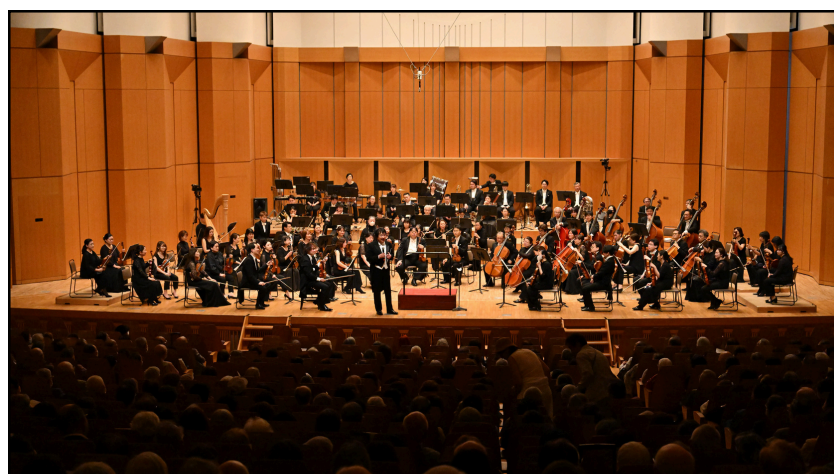
60名のメンバーによる素敵なムード音楽の時間を♪

チケットは現在、玉名市民会館会議棟、荒尾総合文化センター、ながす未来館、熊本県立劇場窓口・ホームページにて好評販売中。一般1500円、高校生以下1000円(当日各500円増)の宝くじの助成による特別な価格で鑑賞が可能です。前売で完売の場合、当日券の販売はありません。車いす席をご希望の場合は玉名市民会館事務局(0968-73-5107)までご連絡ください。