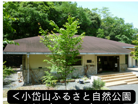
<小岱山ふるさと自然公園ビジターセンター>

【利用時間】9:00～22:00 (受付は体育センターにて) 【休館日】12/28～翌年1/4 鉄骨木造平屋建(六人立) ※弓道場をご利用希望の方は、勤労者体育センターの窓口にて受付をお願いします。 【問合せ】0968-73-5706