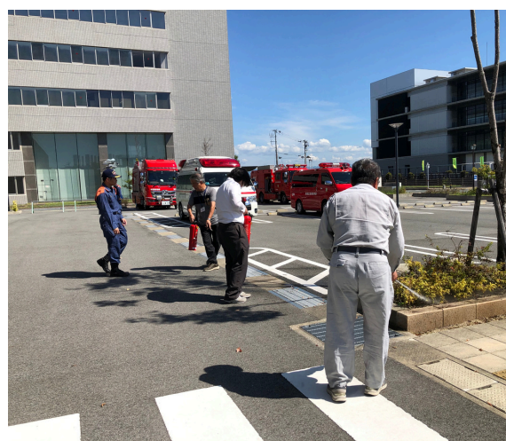
消火器の使い方。ピン・ホース・レバー!

いつでも危機管理 市民会館消防訓練 9月24日(火)、玉名市民会館にて消防訓練を実施しました。玉名市民会館の職員や、シルバー人材センターのメンバーで行う、今年2回目の訓練です。6月に実施した内容は覚えていたでしょうか。実際に災害が起こってしまうと余裕がなくなりますので、復習を含め、再度避難誘導の確認です。今回は消防車2台、また消防署職員の方も10名程お越しくださいました。ドキドキの訓練となりました。ホールの避難誘導について多数指摘を受けましたが、有意義な時間となりました。