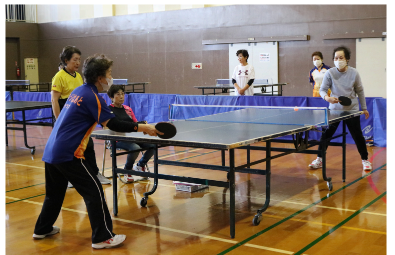
和気あいあいと楽しく、時には真剣に勝負!

11月18日(月)玉名勤労者体育センターにて、第14回健康親善ラージボール卓球大会を開催します。今年は、通常休館日となる月曜日に開催しますので、ご注意ください。毎年、初めての方・常連の方などたくさんのご参加をいただいております。試合は午前中に終わるよう進行しますので、お気軽にご参加ください。出場の申込みは10月15日(火)から29日(火)まで、玉名市民会館会議棟事務局にて受け付けます。申込書に記入の上、参加料を持ってお越しください。日時:11月18日(月)8時30分から受付。9時開会。場所:玉名勤労者体育センター参加料:500円(保険料・参加賞含む)参加資格:熊本県内在住の55歳以上の方内容:エキスパートクラス(旧Aクラス)、エンジョイクラス(旧Bクラス)に分けて行う申込期間:10月15日(火)から29日(火)8時半～17時まで申込場所:玉名市民会館会議棟事務局試合形式:シングルス リーグ戦問合せ:玉名市民会館(73-5107)