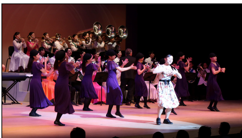
オリジナルショー『ブギ☆ウギ』での華麗な一コマ

来年も同じ時期に公演を予定しております。また素晴らしい演奏会をお届けできればと思います。是非たくさんのご来場をお待ちしております。