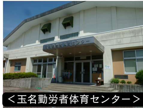
<玉名勤労者体育センター>

【受付時間】8:30～17:00 【利用時間】9:00～22:00 【休館日】12/29～翌年1/3 【部屋】第1会議室(180人)、第2会議室(90人)、第3会議室(45人)、第4会議室(30人)第5会議室(24人)、和室(6畳6～8人) 【問合せ】0968-73-5107