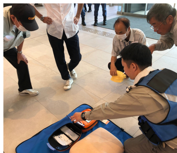
AEDの使い方について指導を受ける