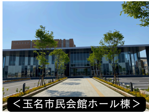
<玉名市民会館ホール棟>

利用が入っていない日はほとんど無いほどの利用率のため、予約は早めにされることをお勧めします。予約はご利用希望日の1年前から可能です。