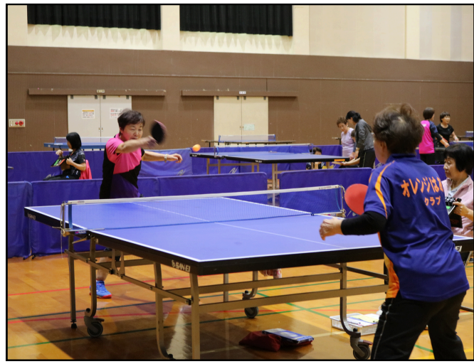
和気あいあいと楽しく、時には真剣に勝負!