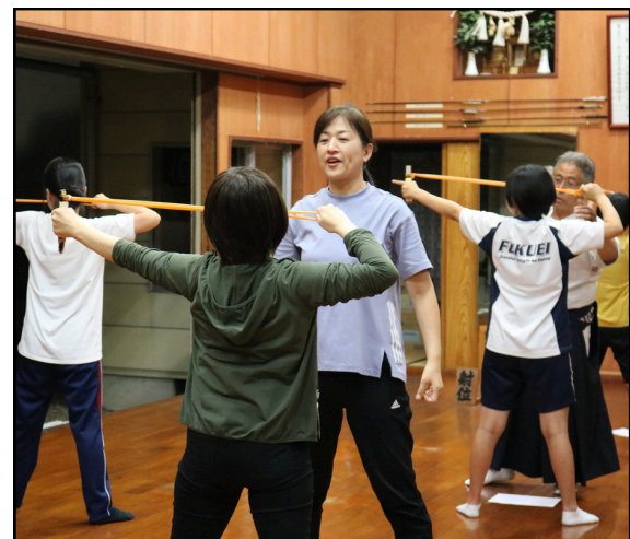
弓道連盟の方に構え方の指導を受ける様子

6月5日(水)から8月9日(金)までの毎週水曜日と金曜日の計20回、玉名市弓道場にて弓道教室を開催しました。玉名市弓道連盟の方々のご協力とアドバイスを頂きながら初めて開催し、10名の方にご参加いただきました。自治振興公社の職員でも普段はなかなか見る事ができない専門的な内容を、受講者さんたちは全20回でじっくりと教わっていたようです。実際に弓矢を放つまでを体験していただきました。筆者もやってみたくったなとも思ったり。 来年度も同じ時期の6月～8月で実施を予定しています。今回参加を逃した方は是非ご参加ください。