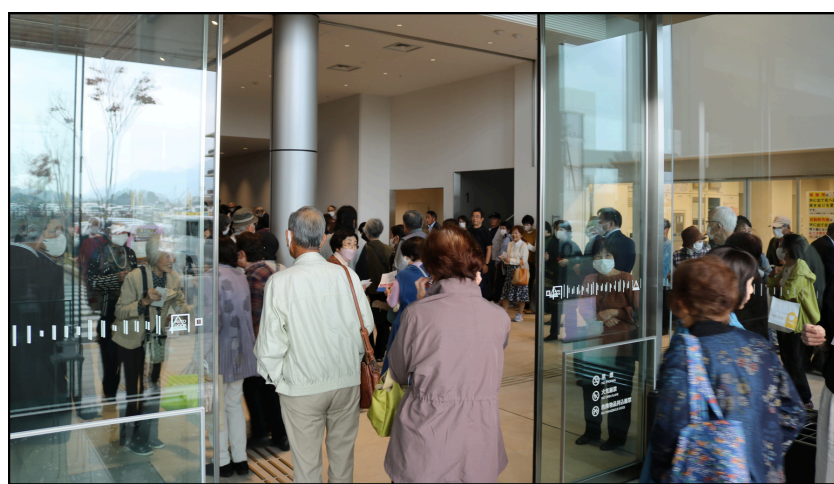
入場時間前のロビーは大混雑！