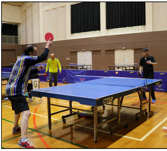
健康親善とは思えない白熱ぶり

11月18日(月)に玉名勤労者体育センターにて、第14回健康親善ラージボール卓球大会を開催しました。11月半ばとは思えない暖かい気候の中、総勢45名の方にご参加いただき楽しく試合を行いました。