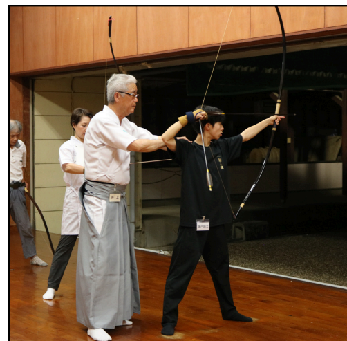
実際に弓を持って射る