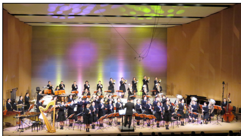
約100名による大迫力の音楽をお聴きください！

今回はニューイヤークンサートではなく、玉名市民会館の自主文化事業としてコンサートを行います。チケットに関して、11月29日(金)から販売を開始し、雨が降り少し肌寒い中、朝6時頃から並んでお待ちいただいた方もいたようです。販売3日目でなんとチケットが完売しました！その後も続々と来られ、完売に驚きを隠せない様子でした。