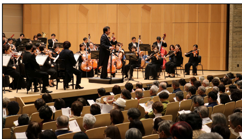
目の前で見えるオーケストラの演奏に釘づけ

13時30分からの開場に対して、楽しみにされた方々が12時頃から続々と来館され始めていました。入場できるまでの開場整理では大変お待たせすることになってしまいましたが、帰り際には、アンケートにより「また聴きたい！」「生演奏に感動した。」次のリクエストです。などみなさまからの熱い感想が多く寄せられました。またCDの販売や指揮者のサイン会など、最後の最後までにぎわった一日でした。