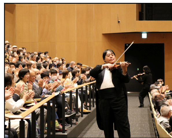
客席での演奏を披露してくれました

宝くじ文化公演事業とは、宝くじの収益金を基に、一般社団法人自治総合センターと開催地の市区町村(東京都23特別区を含み、政令指定都市を除く)、並びに公演会場のコンサートホールの管理・運営を自治体から指定管理者制度の導入により、その指定管理者として委託された公益法人や特定非営利活動法人などの共催により、宝くじの社会貢献活動の一環として地域文化の振興のために取り組む事業のことを指す。関連事業に宝くじスポーツフェスティバルがある。今回行った内容は「宝くじ文化公演」でした。