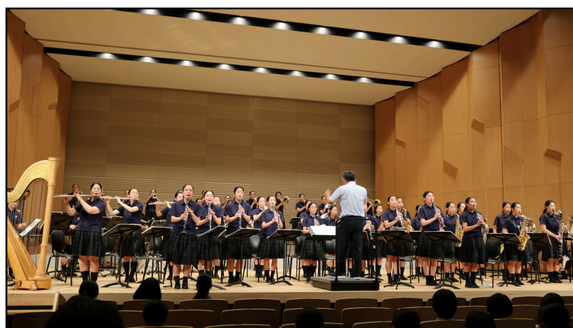
一番前では、息遣いも聞こえる大迫力

全国屈指の実力を誇る玉名女子高等学校吹奏楽部の演奏は、まだ聞いたことがない人もぜひ彼女たちの演奏を見て聞いてほしいと思うほど圧巻のパフォーマンスです。玉名市民会館自主文化事業として4回目を迎える1月12日。迫力のサウンド、完璧に息を合わせた演奏、そして全力で奏でる音を、是非その目でご覧ください!!