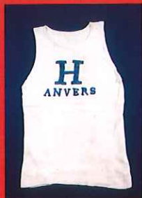
アントワープオリンピック ランニングシャツ

1,000点の資料を3期に分けて展示。 15カ所の音声ガイドで金栗四三の生涯を紹介。