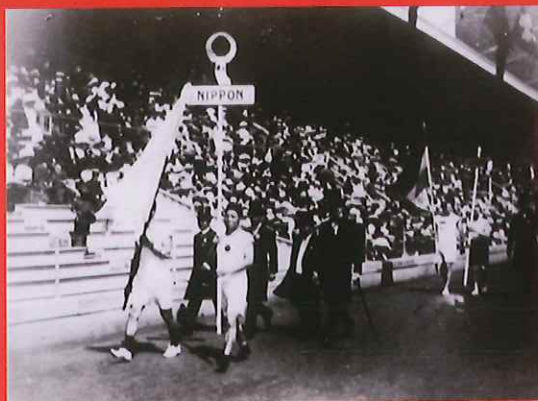
ストックホルムオリンピック入場行進

1,000点の資料を3期に分けて展示。 15カ所の音声ガイドで金栗四三の生涯を紹介。